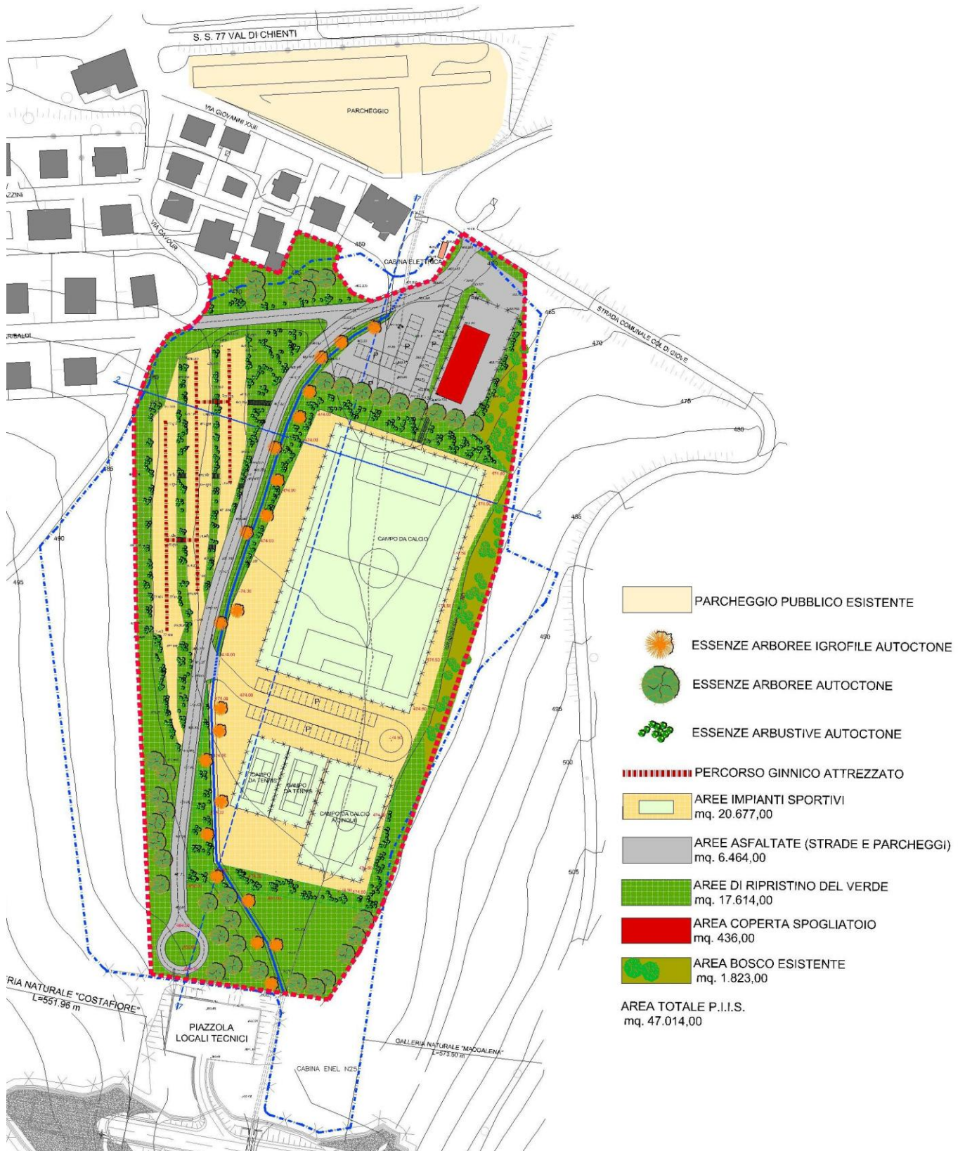
PLANIMETRIA PIANO INSEDIAMENTI IMPIANTI SPORTIVI