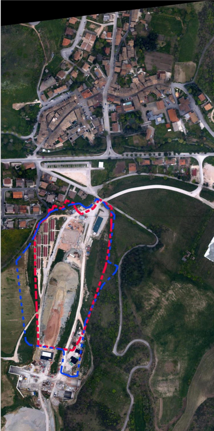
FOTO AEREA STATO ATTUALE

Dette aree attualmente sono soggette ad occupazione provvisoria nell'ambito del cantiere dell'asse viario Umbria - Marche e Quadrilatero di penetrazione interna Maxilotto 1 sublotto 2.1: s.s. 77 "val di chienti" tronco Pontelatrave-Foligno, mentre originariamente erano utilizzate come seminativo.